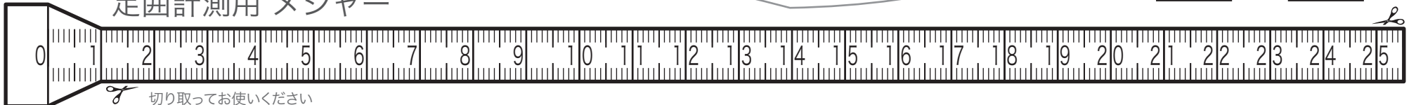
足囲計測用 メジャー